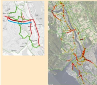
Økt og redusert trafikkmengde i 2030